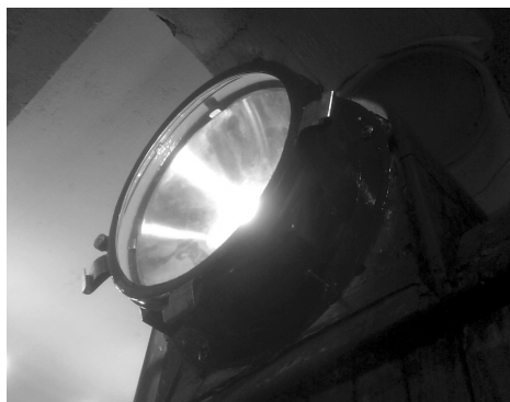
33:ans toppstrålkastare har provmonterats.

Trots allt kräver trafikvagnarna lite tillsyn och de får då och då startas för att ladda batterierna och röra lite på sig. Snart stundar dock den årliga besiktningen och alla vagnar ska få översyn. Motorer öppnas och rengörs, bromsar smörjs och elutrustning ses över, för att nämna några arbetsuppgifter. Vi får hoppas att även årets förberedelser och besiktning går bra.